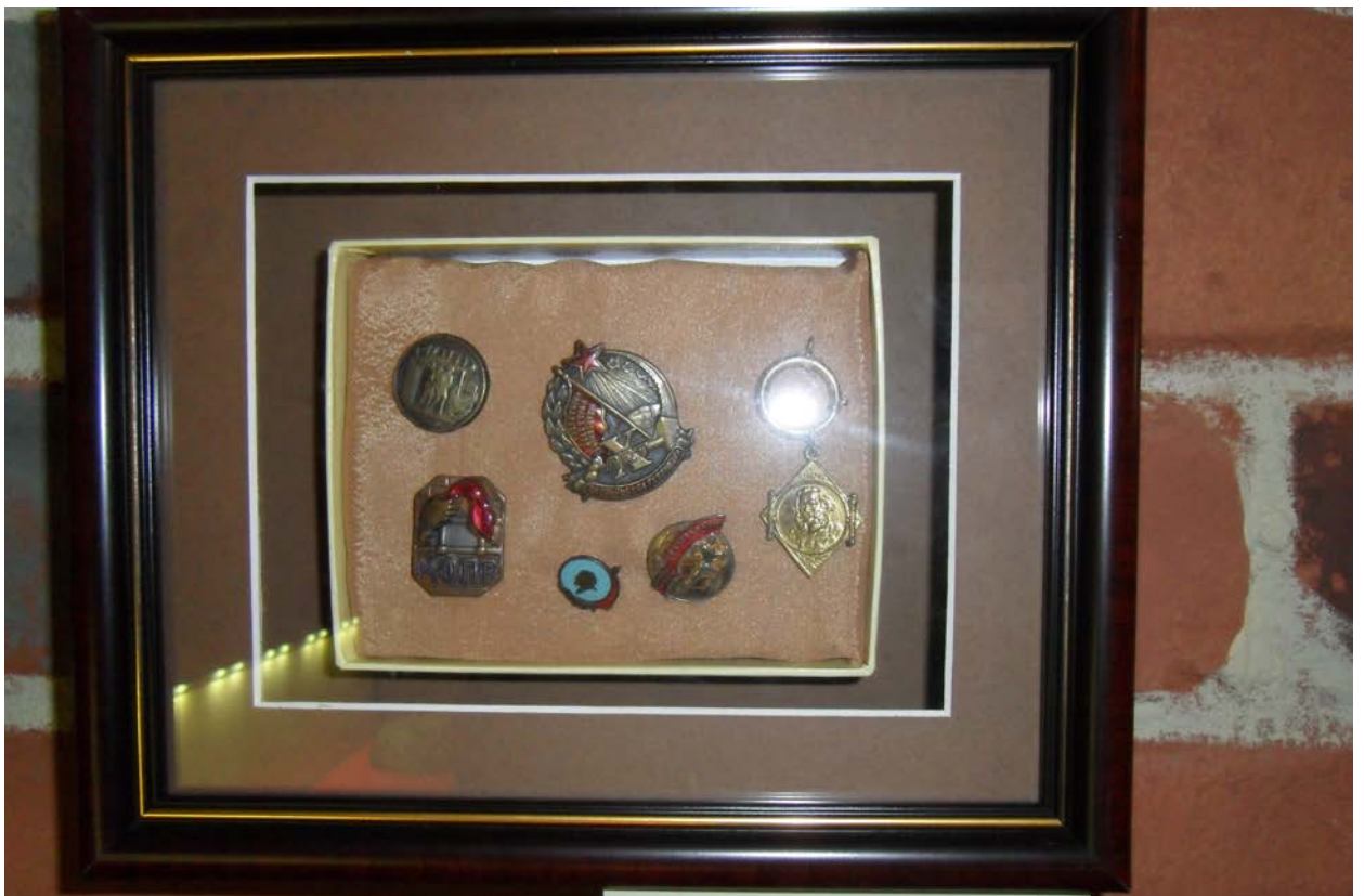
Значки. Продукция артелей с. Красное, 1920-е гг.